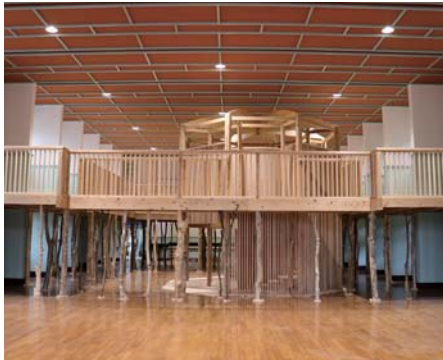
もりのあそびばの鳥海タワー

館内や外構の工事は着々と進行中です。「もりのあそびば」の中央には鳥海タワーがそびえ、木の温もりに包まれた空間となっています。2歳までの乳幼児と保護者だけが利用できる「ハイハイひろば」は床も壁もやわらかい秋田杉が使用されています。グラウンドの奥と鮎川沿いの河川広場には駐車場が整備され、お客様を迎える準備が進められています。