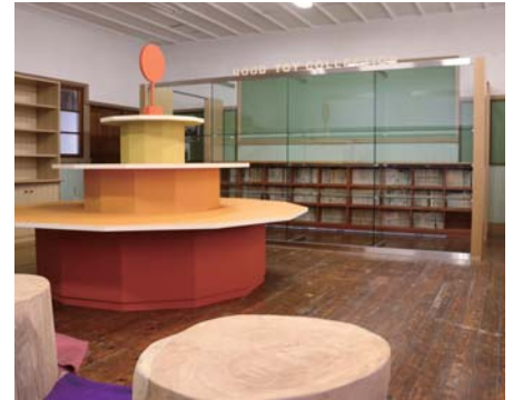
グッド・トイ サロン