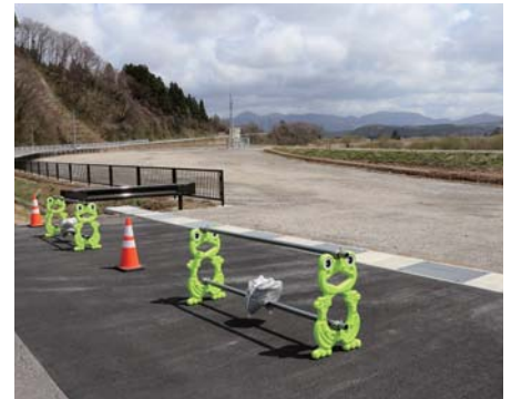
鮎川河川広場 駐車場 (70台)