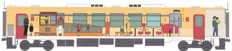
おもちゃ列車 整備イメージ