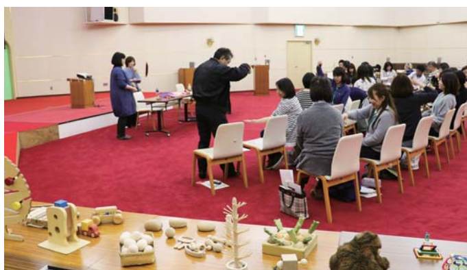
おもちゃ学芸員養成講座は3月に第3期が開催されました

子どもたちが楽しく安心して遊び、学び、そして、市内外・県内外からお客様をお迎えするためには、ボランティアスタッフである「おもちゃ学芸員」の方々の養成とスキルアップが欠かせません。「おもちゃ学芸員」は現在、約 90 名の方が養成講座を受講済みで、今年度も 90 名程度の養成を見込んでいます。おもちゃと遊びはもちろん、秋田や由利本荘、そして鮎川地域の魅力を発信する大きな力になると期待しています。