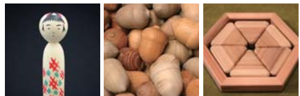
由利本荘市産 木のおもちゃのイメージ