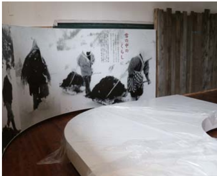
ゆきぐにの民具展示室