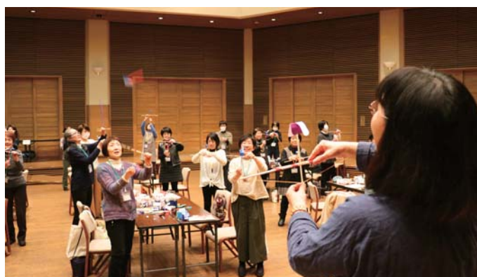
養成講座受講済みのおもちゃ学芸員に向けた手作りおもちゃ講習会

また、館内のトイ・ショップとダイニング・キッチンの出店公募が行われ、トイ・ショップは羽後本荘駅前木工品店を運営する株式会社 鳥海ドライブ、ダイニング・キッチンは美術館と同じく当 NPO 法人が運営事業者として決定しました。トイ・ショップは、子どもの遊びや学びを刺激するとともに、おとも楽しめる国内外のおもちゃがラインナップされ、見て触れて購入できるお店になる予定です。ダイニング・キッチンは、地域の魅力を活かしつつ、小さなお子さんも安心して過ごせるお店になる予定です。美術館にお越しの際は、ぜひ、これらのお店も覗いてみて下さい。