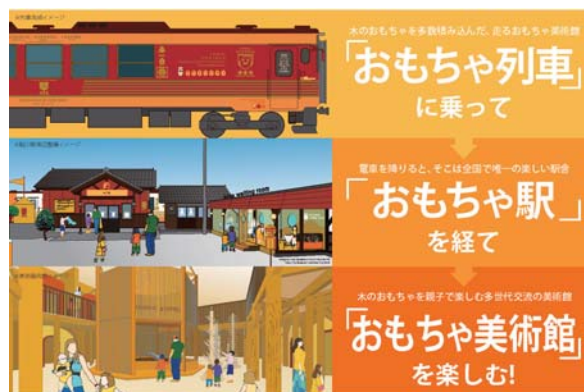
列車と駅と美術館を繋ぐ一体化構想

人々の思いによって素晴らしい駅が出来上がります。これからは、その思いを地域が受け取り、更に大きく育て、応えていくこととなります。