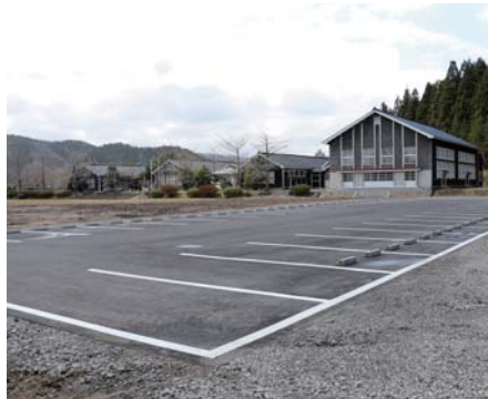
グラウンド奥 駐車場 (30台)