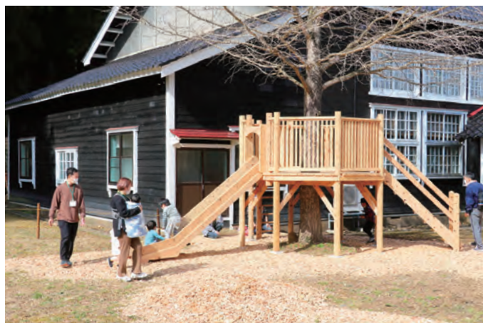
屋外遊具で遊べる「もりのなかにわ」